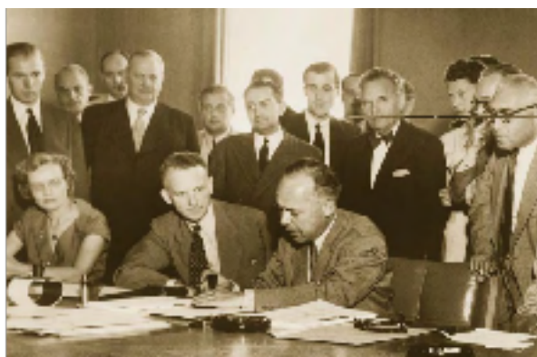
Firma histórica de la Convención de 1951 sobre los refugiados.

Por otro lado, los tratados internacionales en búsqueda de protección del refugiado van a partir de la Declaración Universal de Derechos Humanos que consagra que toda persona independientemente de su condición es sujeto de derecho. Tal es el caso de los refugiados, quienes al abandonar su país de origen por motivos sociales, ambientales, crisis políticas, económicas, conflictos armados, u otros motivos, se encuentran en un grado mayor de vulnerabilidad y afectación de sus derechos y libertades. Por ello, los tratados y el derecho internacional humanitario deben actuar con mayor visibilidad en aras de no mermar ni desproteger los derechos fundamentales de los migrantes, quienes viajan hacia otros países en aras de tener una mejor condición de vida. En la misma línea, otro tratado internacional crucial es la Convención sobre el Estatuto de los Refugiados publicado en el año 1951 [17]. En él se establece que los Estados tienen la obligación de colaborar con la Agencia de la ONU para los Refugiados para garantizar que los derechos de las personas refugiadas se respeten y protejan.