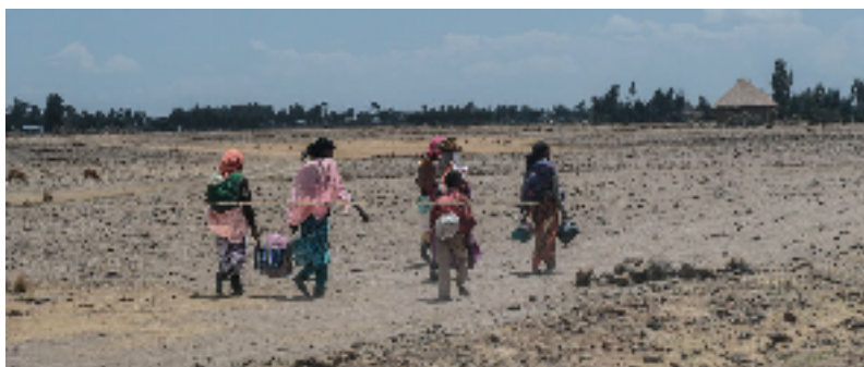
Migrantes de África.

En el análisis de un caso específico, encontramos que las causas del desplazamiento en el flujo migratorio de Mali, ubicado en África occidental, se debe a una costumbre de emigrar desde temprana edad a España, debido a que sus comunidades se encuentran abandonadas, y la agricultura —su actividad primaria— se ve afectada por sequías que van en aumento a medida que se ha intensificado el impacto del calentamiento global. La situación en Mali denota que la falta de políticas de desarrollo económico en materia de agricultura y sobre la crisis climática no garantiza la integridad de sus habitantes, quienes necesitan de dicha actividad para mantenerse a flote económicamente.