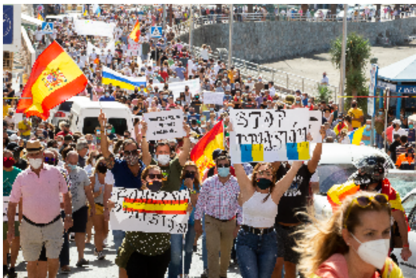
Protesta contra la situación migratoria en Arguineguin, España.

De esta manera, las fuertes divergencias entre los Estados miembros de la UE, especialmente entre los estados orientales y occidentales, han aumentado la desconfianza entre ellos y hacia los instrumentos existentes. Además, después de años de despolitización de la integración de las políticas de asilo y migración, estas políticas se han politizado en gran medida [25]. La politización se ha manifestado en toda Europa, con fuerzas políticas denunciando la política europea de migración. En Europa Central y Oriental, la crisis de los refugiados ha alimentado el "nacionalismo defensivo", mientras que en Europa occidental, esto se asocia más con un proceso de "desnacionalización" particularmente sentido como resultado de la globalización. Estas divisiones han llevado a políticas reactivas o de statu quo por parte de los líderes políticos.