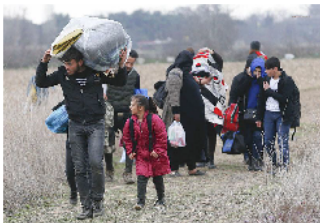
Familia de migrantes en la frontera de Turquía y Grecia.

El derecho del menor a no ser separado de los padres es un derecho en constante vulneración a lo largo de las fronteras europeas. Según el Alto Comisionado de las Naciones Unidas para los Refugiados, al 30 de julio del 2020 habían 4,558 niños no acompañados en las fronteras de Grecia, entendiendo que los niños no acompañados son menores que “han sido separados tanto de sus padres como de otros familiares y no están siendo cuidados por un adulto que, por ley o costumbre, sea responsable de hacerlo” [36]. Ejemplo de ello es un caso observado por la Oficina, en el cual un niño fue separado de su primo de 19 años con el que se encontraba migrando, sin posibilidad de contactarlo y ocasionando retrasos en la reunificación familiar.