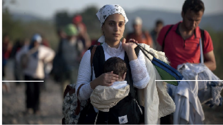
Madre de familia migrante a raíz de la guerra con Siria.

Por otro lado, las causas de la migración proveniente de África hacia Europa son motivadas por el factor socioeconómico, es decir, la falta de trabajo y pobreza, siendo que las personas migrantes son originarias de países con indicadores de desarrollo muy bajos. Al mismo tiempo, está el factor demográfico relacionado a la sobrepoblación, puesto que la urbanización y masificación de la población genera que las personas emigren haciendo uso de rutas clandestinas hacia el continente europeo [4].